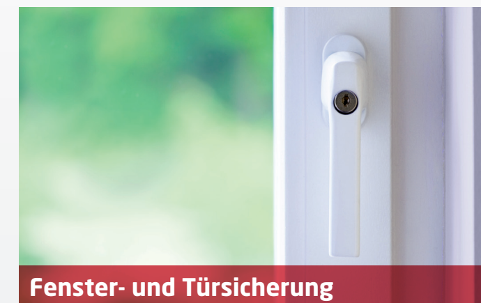
Fenster- und Türsicherung

Rauchmelder in unterschiedlichen Räumen können miteinander verknüpft werden. Im Brandfall wird zeitgleich ein Alarm ausgelöst und die Beleuchtung auf dem Weg nach draussen eingeschaltet.